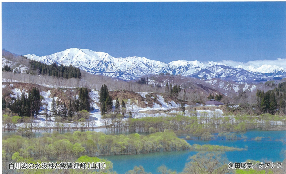
白川湖の水没林と飯豊連峰(山形)