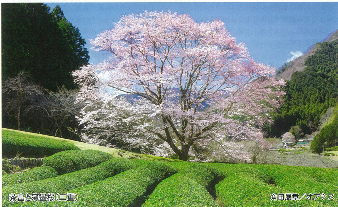
茶島と薄墨桜(三重)