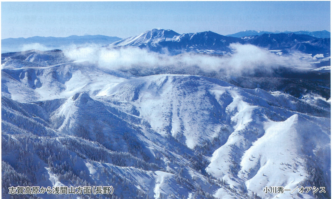
志賀高原から浅間山方面(長野)