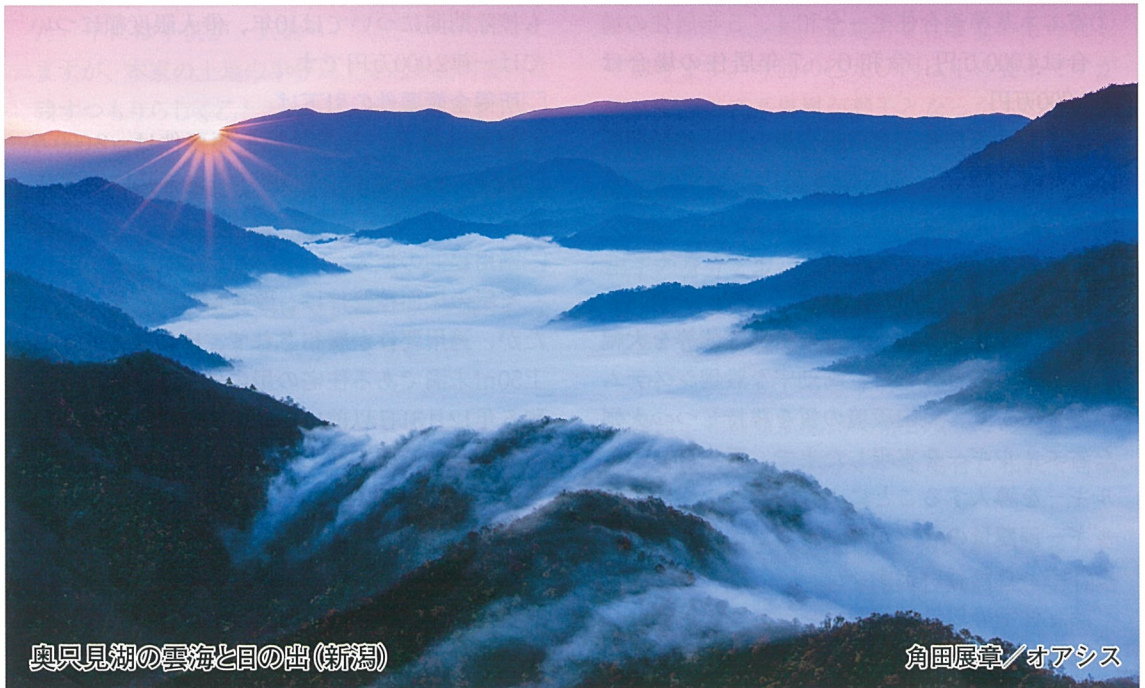
奥只見湖の雲海と日の出(新潟)