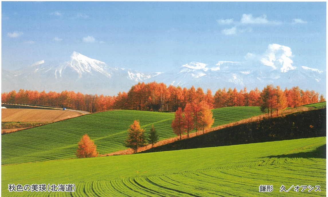
秋色の美瑛(北海道)