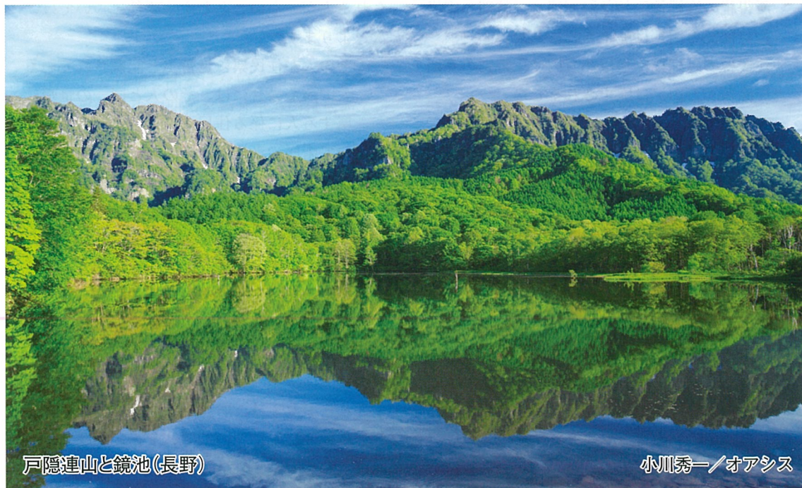
戸隠連山と鏡池(長野)