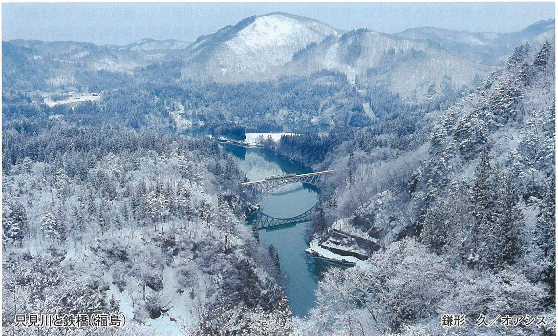
只見川と鉄橋(福島)