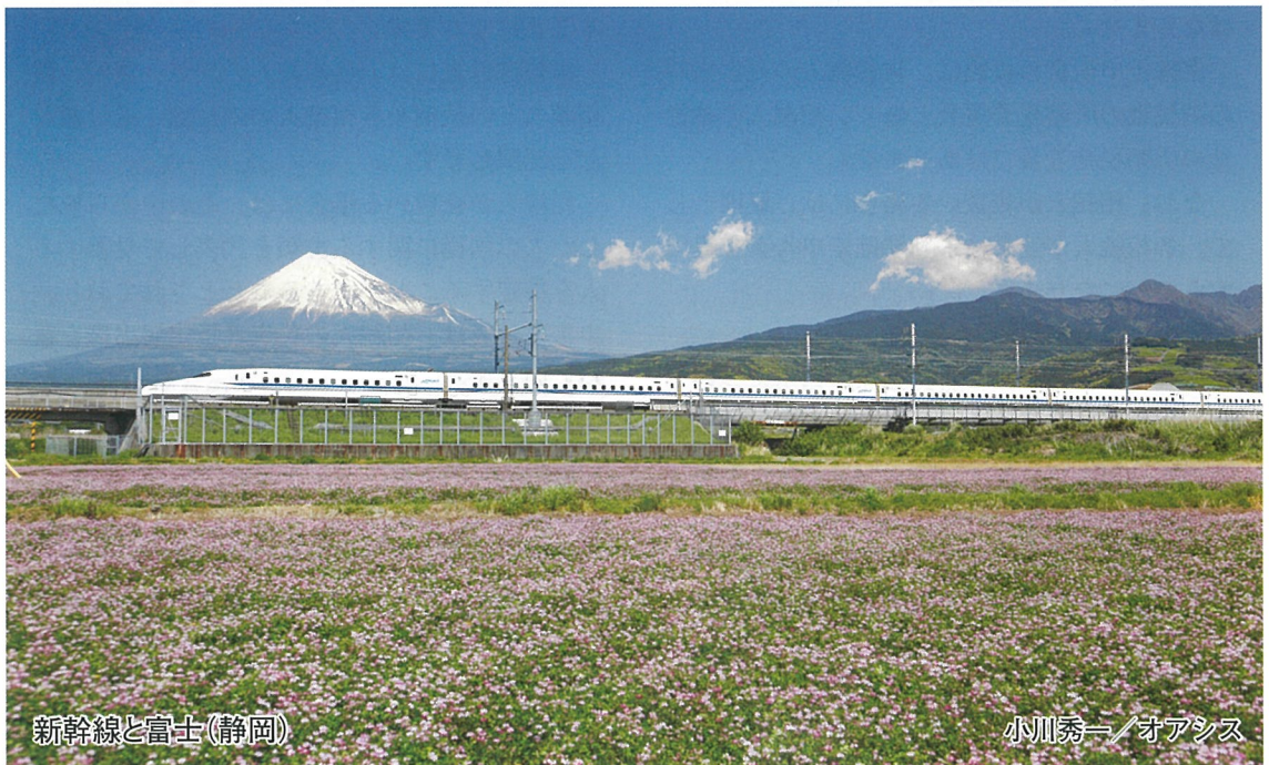
新幹線と富士(静岡)