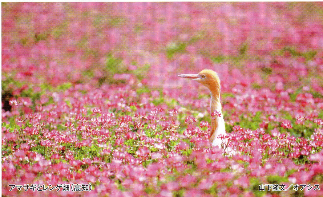
アマサギとレンゲ畑(高知)