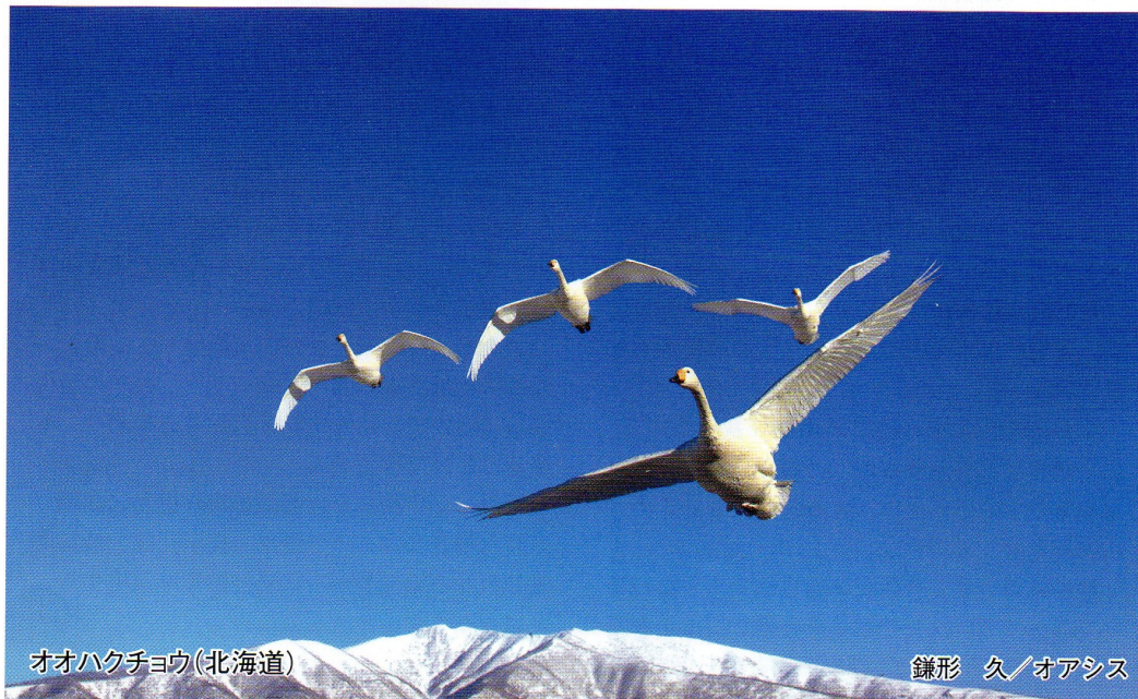
オオハクチョウ(北海道)