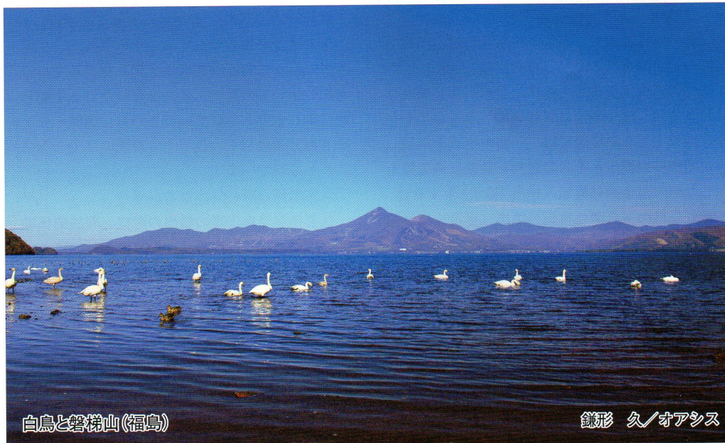
白鳥と磐梯山(福島)