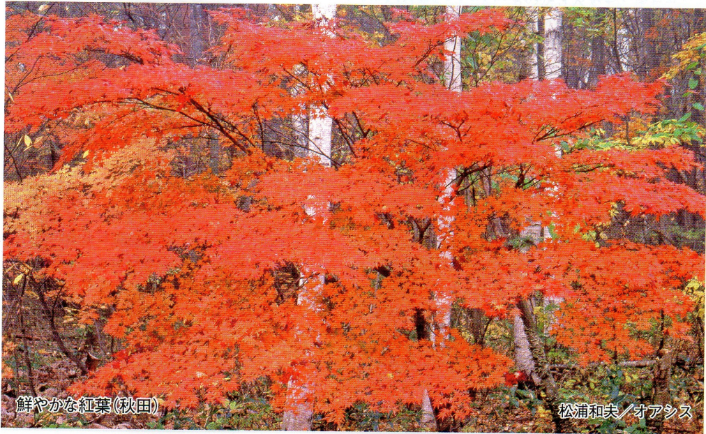
鮮やかな紅葉(秋田)