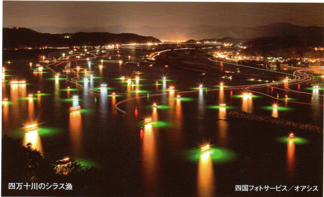
四万十川のシラス漁